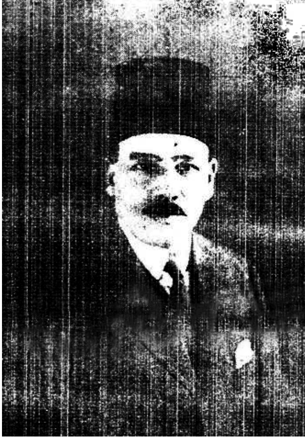
صاحب السعادة الدكتور محمد باشا شاهين – الطبيب الخاص لجلالة الملك، ووكيل وزارة الداخلية للشئون الصحية.