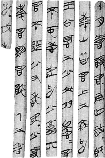
الكتابة الصينية القديمة على شرائح سيقان نبات البامبو

كاتبه سون تزو (أو السيد/الحكيم/القائد سون) تدرج حتى شغل منصب القائد الأعلى لجيش مملكة وو، وهو وضع كتابه هذا بناء على طلب من الملك، وخصه لصفوة القادة العسكريين في زمنه، على أن نصائحه ومبادئه استوعبها الجميع وحتى يومنا هذا، بداية من محاربي الساموراي اليابانيين الأشداء، ومروراً برائد نهضة الصين ماو زدونغ، وانتهاء برجال الأعمال المتمرسين في وقتنا الحاضر.